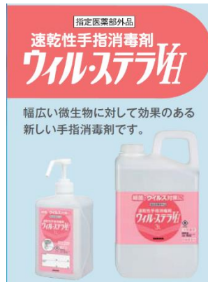
有効成分：エタノール76.9～81.4vol%